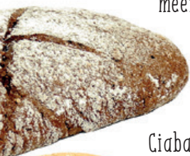
Ciabatta klooster meergranen bake-off 2,95