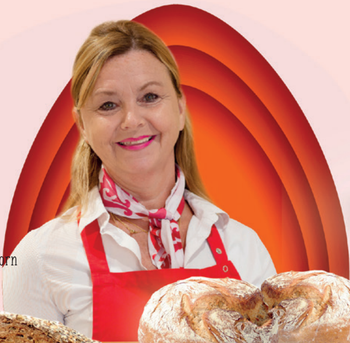
Desem waldkorn 3,80