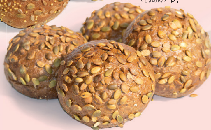
Pompoenpit bollen bake-off (4 stuks) 3,15