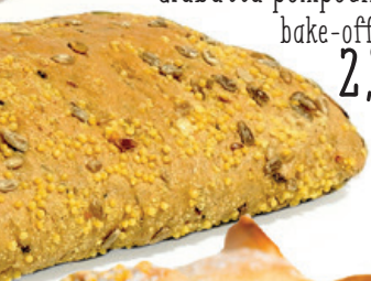
Ciabatta pompoen bake-off 2,95