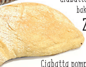
Ciabatta wit bake-off 2,70