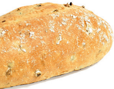
Olijven vloerbroodje 3,65