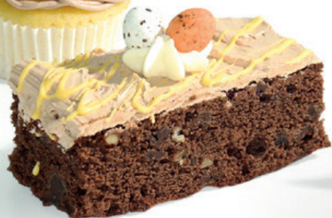
Paas brownie 2,00