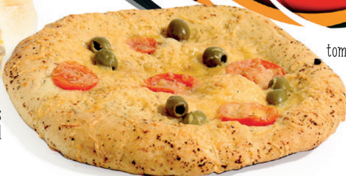
Focaccia tomaat olijf bake-off 3,40