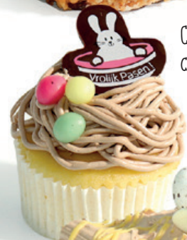
Cupcake vanille chocolade 2,10