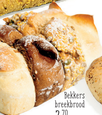
Bekkers breekbrood 2,70