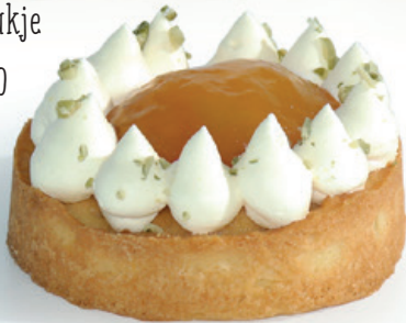
Vegan abrikozen gebakje 2,40