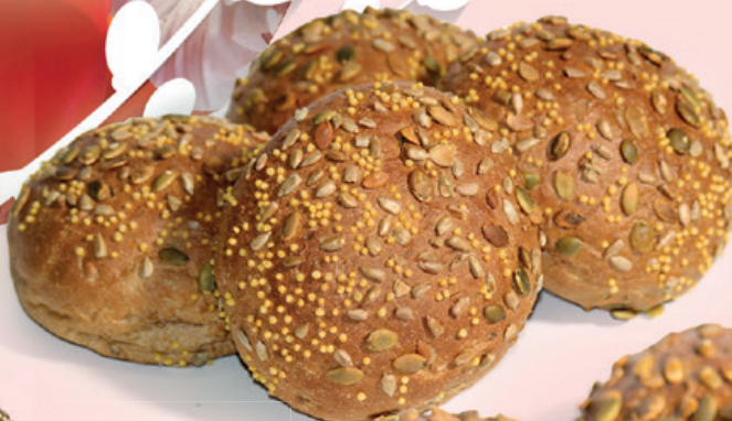
Juttersbollen bake-off (4 stuks) 3,15