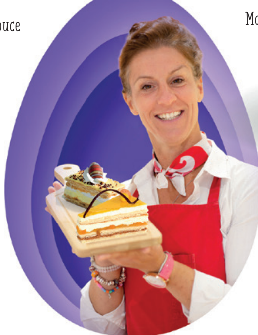
Marsepein gebak 2,50