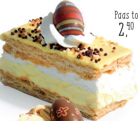
Paas tompouce 2,40