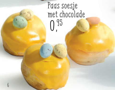
Paas soesje met chocolade 0,95