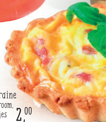
Quiche lorraine gevuld met room, prei en spekjes 2,00