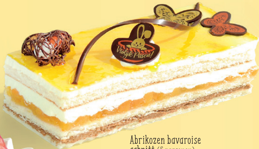
Abrikozen bavaroise schnitt (5 personen)