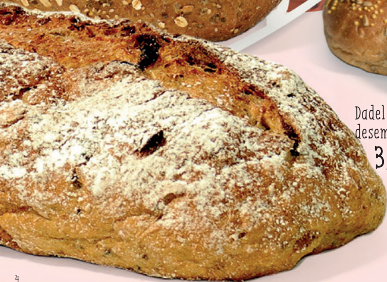
Dadel walnoten desemmikske 3,75